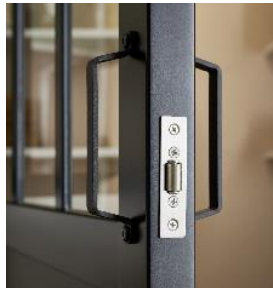
Serrure olive et gâches posées en usine